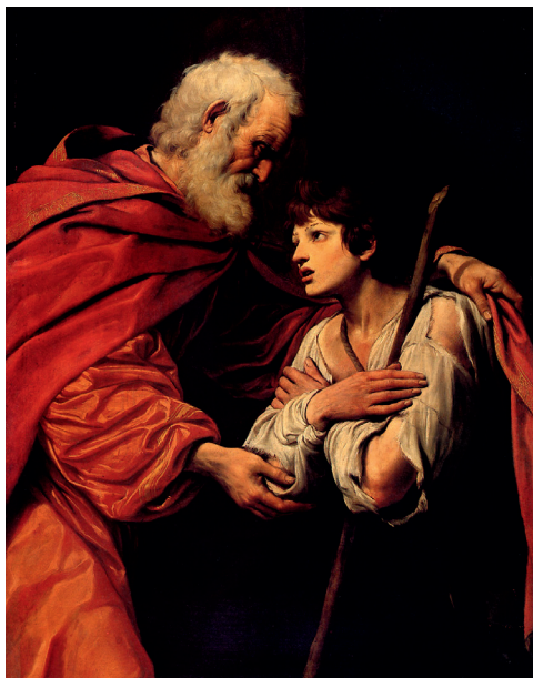
Лионелло Спада. Возвращение блудного сына. 1576 -1622

Однако Священное Писание утверждает важный принцип: «...сын не понесет вины отца, и отец не понесет вины сына, правда праведного при нем и остается, и беззаконие беззаконного при нем и остается» (Иез. 18:20). Может показаться, что данный текст противоречит содержанию второй заповеди. Однако это не так. В этом случае речь идет об индивидуальной ответственности