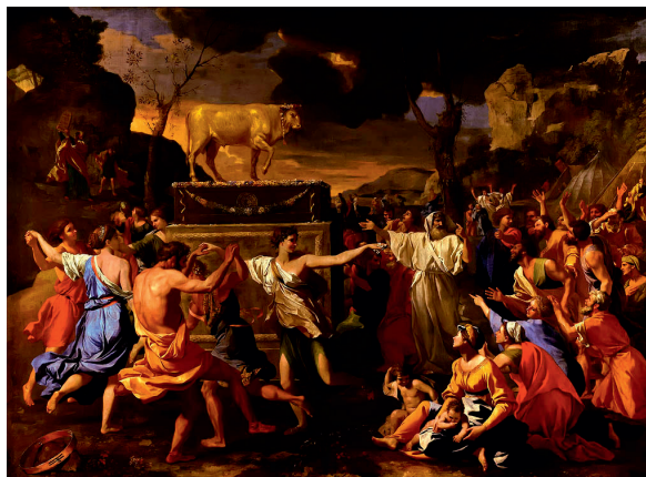
Никола Пуссен. Поклонение израильтян золотому тельцу. 1634

Конечно, в наше время редко встречаются те формы идолопоклонства, какие бытовали в древности, однако в Священном Писании идолопоклонство понимается намного шире. Идол – это то, что в нашей жизни занимает место, по праву принадлежащее одному лишь Господу Богу: работа, материальные ценности, увлечения, порочные привычки. Людям