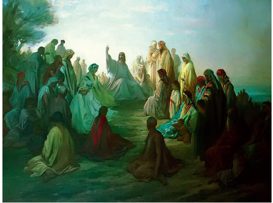
Густав Доре. Нагорная проповедь. 1832-1833

Если мы осознаем, как любит нас Бог, мы будем способны любить, потому что любовь Бога вызовет у нас ответное чувство: «Возлюбленные! если так возлюбил нас Бог, то и мы должны любить друг друга» (1 Ин. 4:11) . Иисус говорит о том, что послушание – это результат любви к Богу.