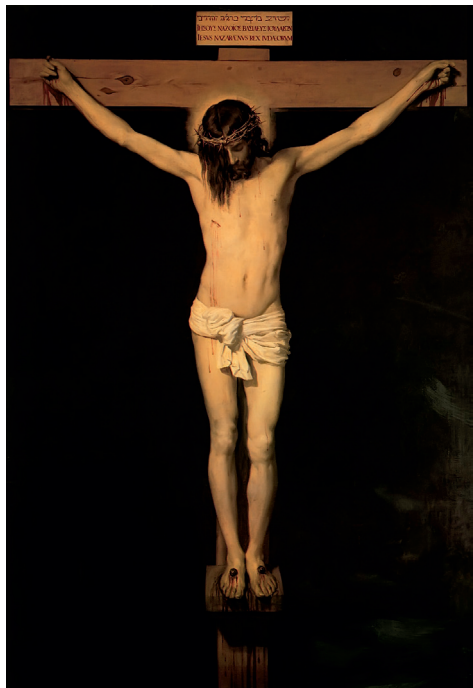
Диего Веласкес. Христос на кресте

«отняв силы у начальств и властей (дьявола), властно подверг их позору, восторжествовав над ними Собою» (Кол. 2:15).