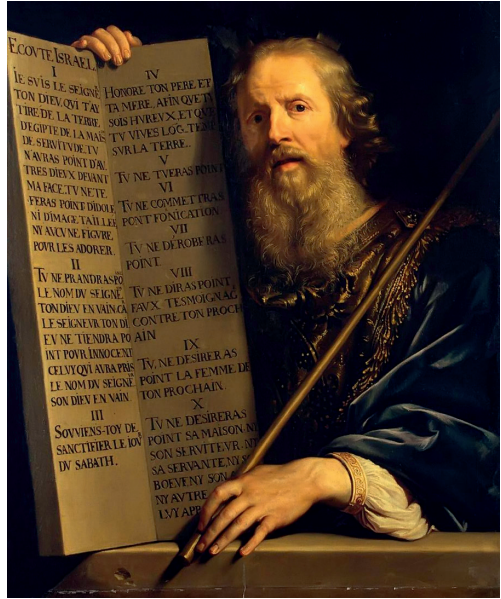
Филипп де Шампень. Моисей и десять заповедей. 1648

В некоторых современных христианских течениях бытует мнение, что в Новозаветную эпоху христиане уже не связаны обязательством соблюдать