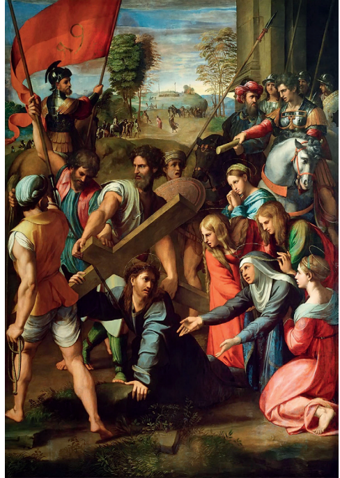
Рафаэль Санти. Несение креста. Ок. 1516