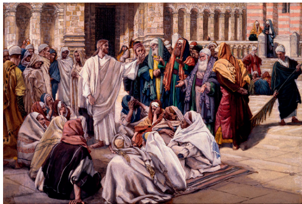
Джеймс Тиссо. Обличение фарисеев и книжников. 1886

Изменение Закона Божия свидетельствует о сбывшемся пророчестве апостола Павла о том, что «человек греха» будет «выдавать себя за Бога» (2