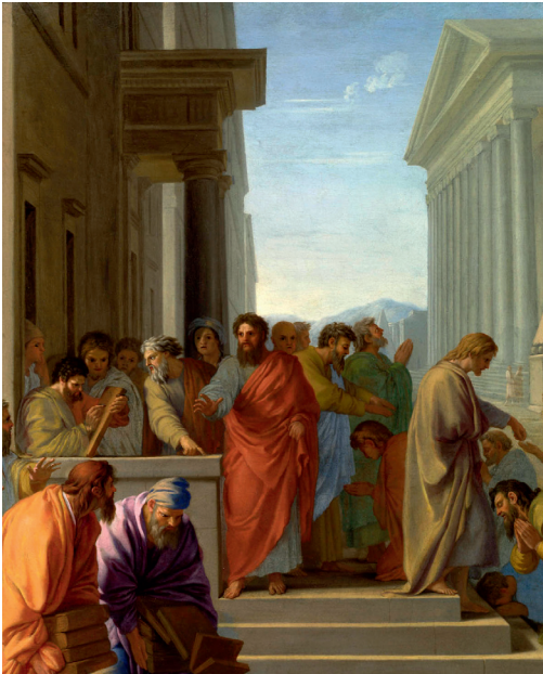
Эшташ Леслиэр. Проповедь апостола Павла. Фрагмент. 1649

Как в ветхозаветные времена, так и во времена апостолов суббота была днем, когда люди собирались, чтобы вместе славить Бога и молиться.