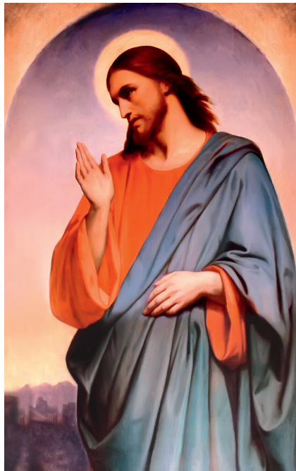
Ари Шеффер. Плач Христа об Иерусалиме. 1851

Суббота – это нерушимый памятник во времени, призванный увековечить акт Божьего творения, еженедельное напоминание о том, что у нашего мира есть Автор, Архитектор и Строитель. Суббота призвана напоминать о Творце, следовательно, она никак не могла быть учреждена на ограниченный срок, для определенного народа или быть отменена. Заповедь о субботе дана для всех времен и народов.