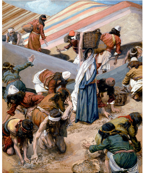
Джеймс Тиссо. Собрание манны. 1896

Заповедь о субботе была установлена от дней творения, более чем за две тысячи лет до появления Авраама, прародителя еврейского народа. В Библии нет