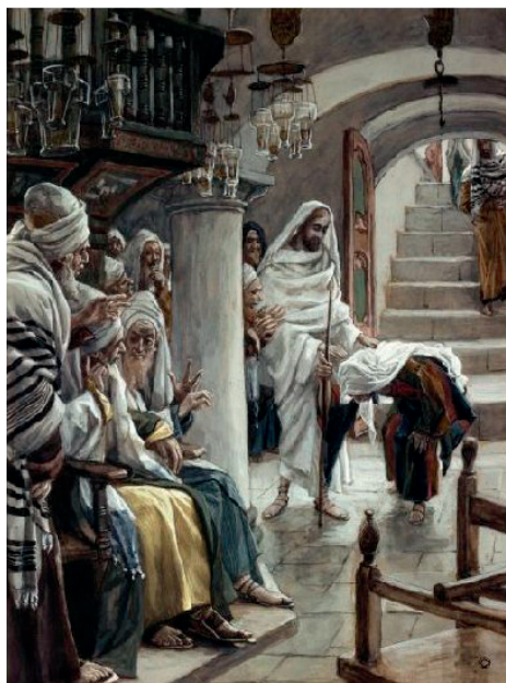
Джеймс Тиссо. Исцеление сгорбленной женщины. 1886-1894

знать Иисуса и искали убить Его за то, что Он делал такие дела в субботу» (Ин. 5:16).