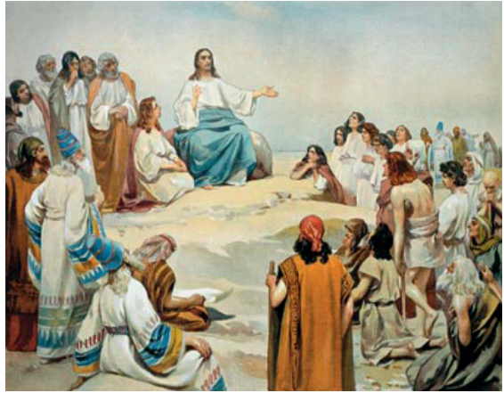
К. В. Лебедев. Нагорная проповедь

Бесспорно, Бог с нами всегда. Особое присутствие Бога в субботний день заключается не в том, что Господь приходит к нам исключительно в этот день, а в том, что в этот день