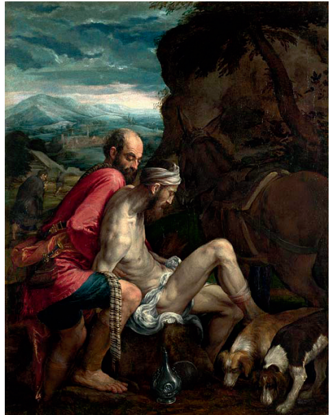
Якопо Бассано. Милосердный самарянин ок. 1562-1563

Но суббота – это не день полной праздности. Заповедь гласит: «день