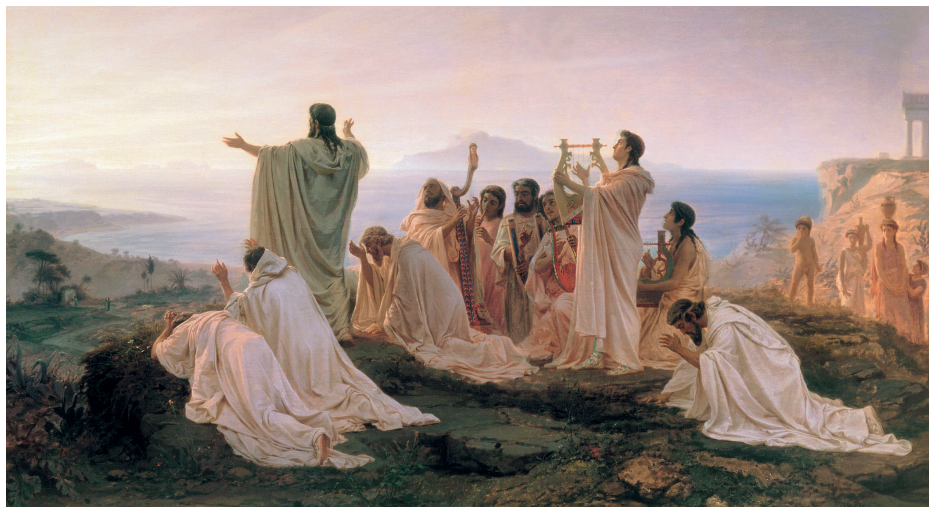
Ф. А. Бронников. Гимн пифагорейцев-солнцепоклонников восходящему солнцу. 1869

Христиане в те времена, на взгляд римских властей, мало чем отличались от иудеев – они соблюдали те же заповеди, так же святости субботу. Для того, чтобы отмежеваться от опальных иудеев и избежать репрессий, христиане изменили день поклонения с субботы на первый день недели. А так как в этот день в Римской империи практиковался культ поклонения солнцу*, христиане не только показали римским властям, что не имеют с евреями ничего общего, но и продемонстрировали лояльность к религии императора.